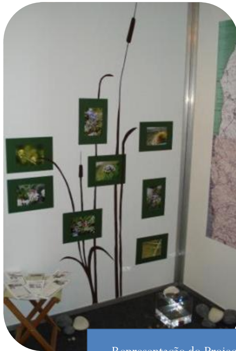
Representação do Projecto na Feira de S. Pedro (Torres Vedras)