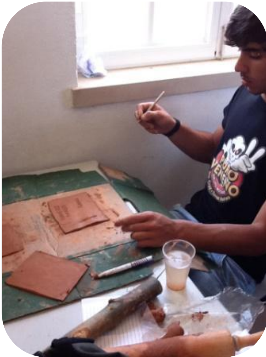
Escola Profissional Agrícola Fernando Barros Leal