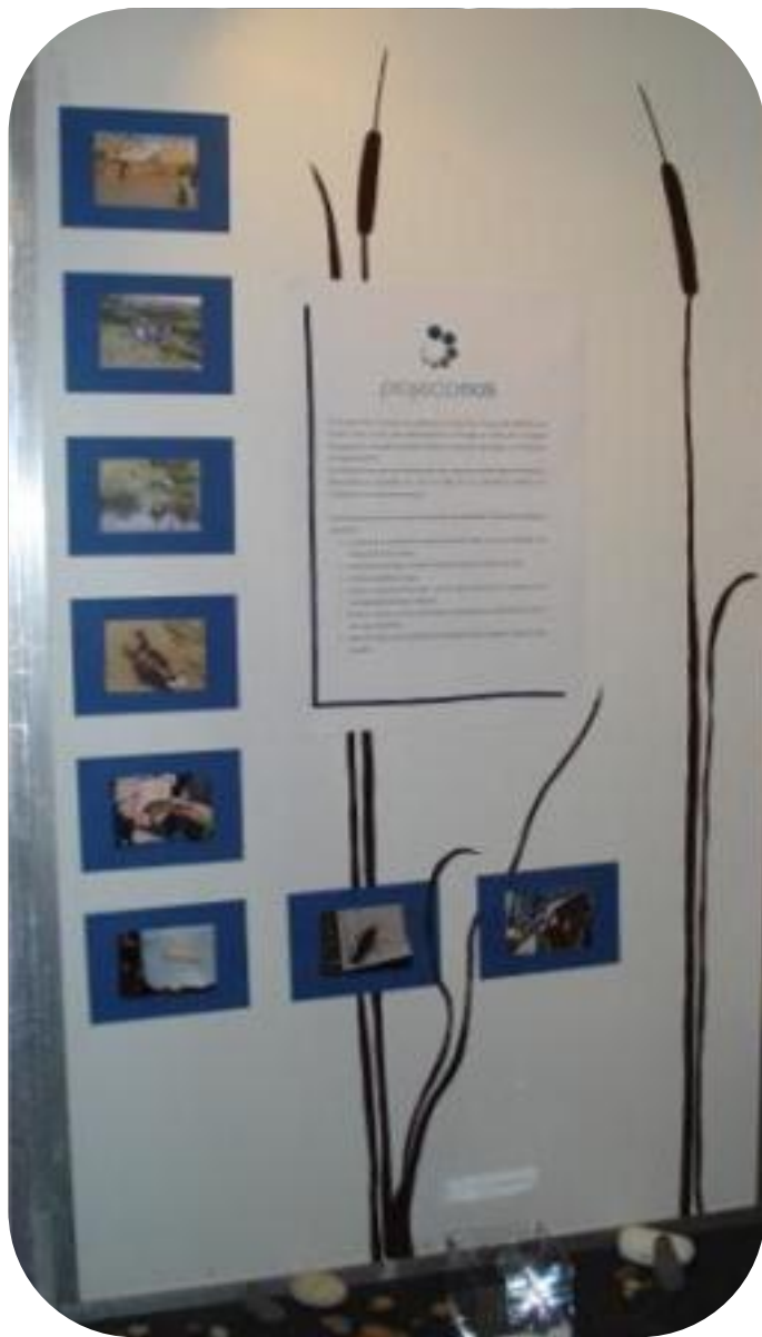
Escola Profissional Agrícola Fernando Barros Leal