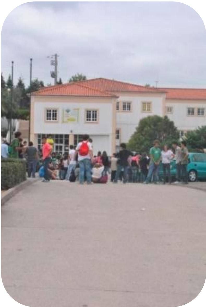
Escola Profissional Agrícola Fernando Barros Leal