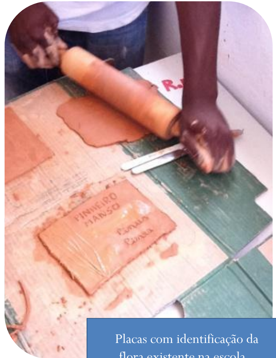
Placas com identificação da flora existente na escola