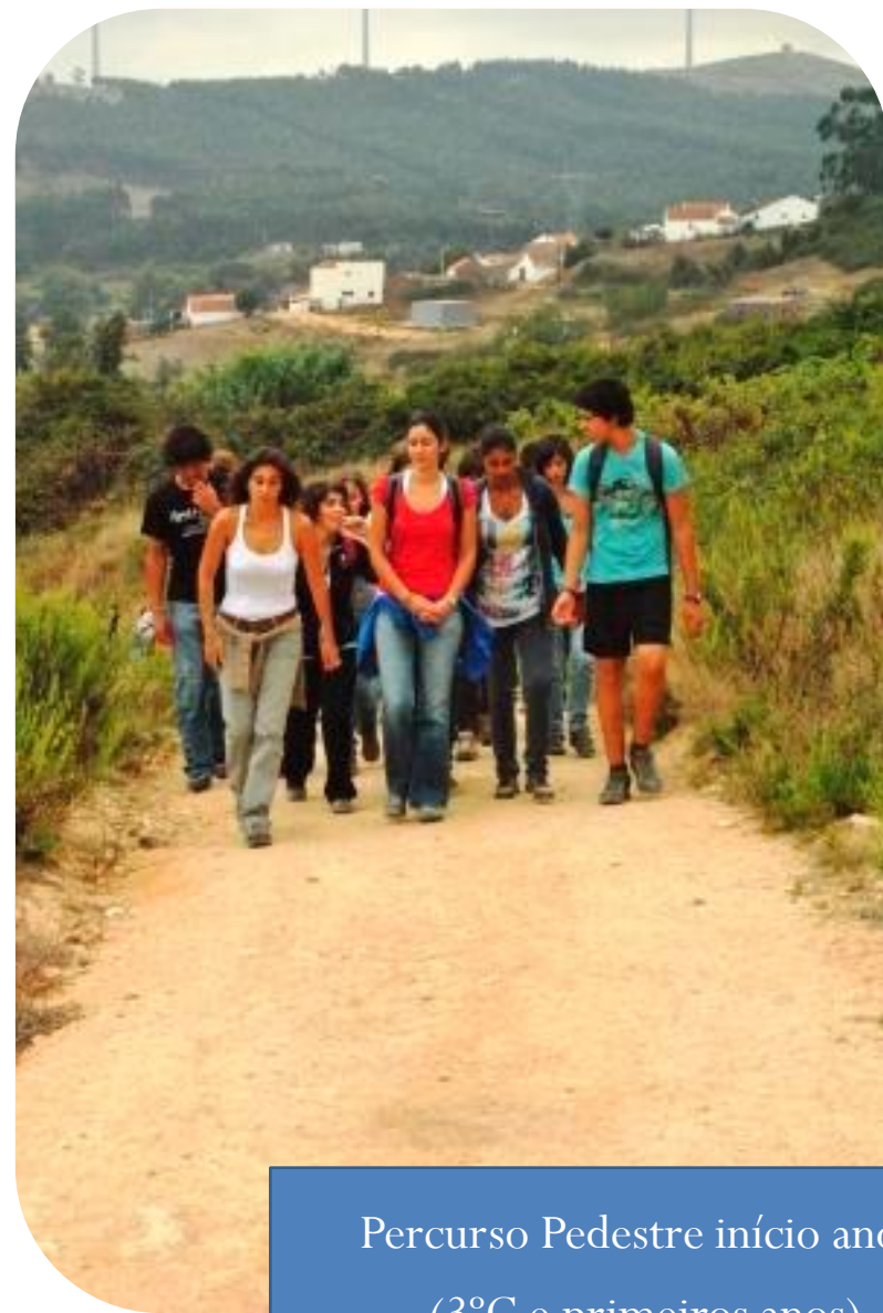
Percurso Pedestre início ano (3 o C e primeiros anos)